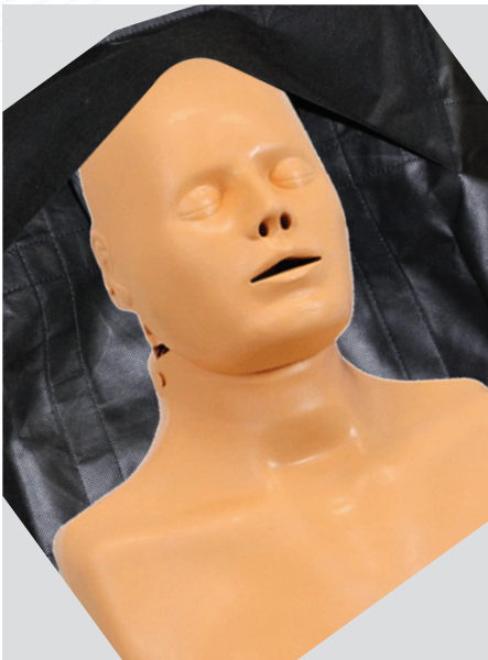
Zusätzlicher Schutz durch Kopfteil