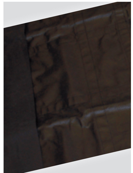
doppelt PVC beschichtete Polyester-Planen-Material