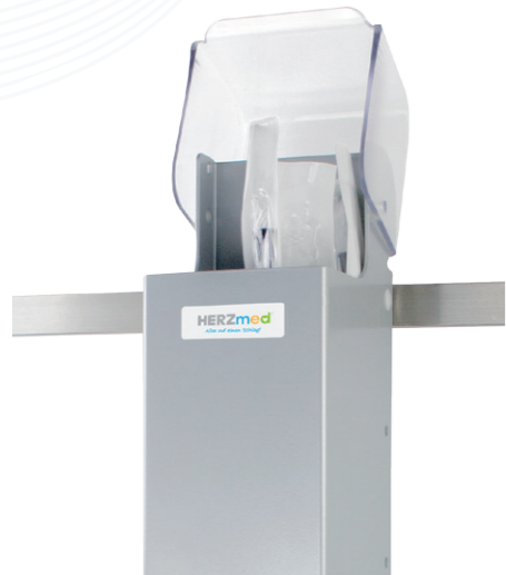
Montage an Normschiene

Die stabile Einheit wehrt Staub, Schmutz, übermäßigen Lichteinfluss sowie Beschädigungen durch mechanische Einflüsse ab. Ein trockener, abgeschlossener und sauberer Innenraum sowie glatte, pulverbeschichtete Oberflächen ermöglichen eine optimale hygienische Reinigung. Daher eignet sich die Einheit Katheterköcher & Aufbewahrungsbox besonders für den Einsatz in Kliniken, Krankenhäusern, in Arztpraxen und im Pflegebereich.